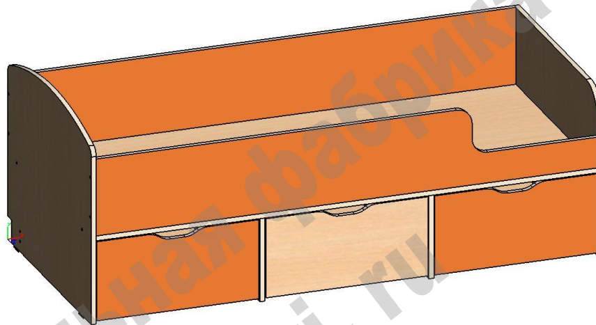
СХЕМА СБОРКИ Кровать «Малыш Мини»